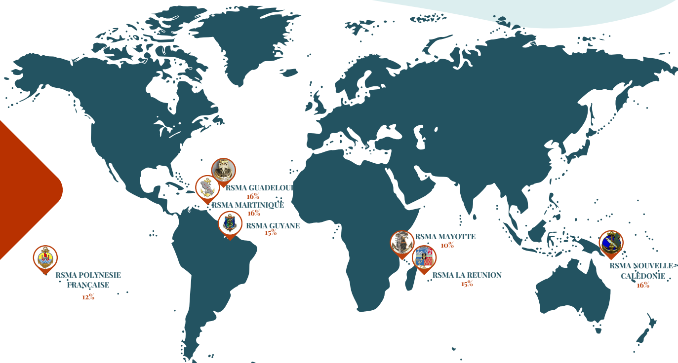
% Répartition des projets soutenus par territoire